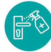
Fângö â makongo Â ndô sô a ndu ni mingi.