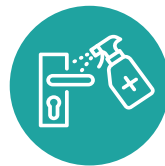
විෂබීජනාශකය කරන්න වැඩිපුර ස්පර්ශ කෙරෙන ස්ථාන.