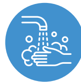
ඔබේ දෑත් නිතරම සෝදන්න.

බොහෝ සෞඛ්‍ය විශේෂඥයින් නවදුරටත් නිර්දේශ කරනුයේ, විශේෂයෙන්ම බොහෝ පුද්ගලයින් අසල සිටින්නේ නම් සහ ගෘහස්ථ ස්ථානවල ඒකරාශී වේ නම්, එන්නත ලබාගත් පුද්ගලයින් විසින්ද මෙම පූර්වාරක්ෂණ ක්‍රම අනුගමනය කළ යුතු බවයි.