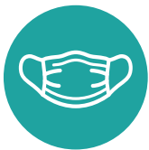
මුහුණු ආවරණයක් පළකරන්න.

ඩෙල්ටා ප්‍රභේදය කෝවිඩ්-19 ප්‍රභේදයට වඩා වැඩි වේගයෙන් ව්‍යාප්ත වේ. ඔබ සම්පූර්ණ වශයෙන් එන්නත් ලබා ගෙන නොමැති නම්, පහත ආකාරයට ඔබ සහ ඔබගේ ප්‍රජාව ආරක්ෂා කර ගන්න: