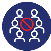
බොහෝ අය රැස්වන ස්ථානවලට යාමෙන් වළකින්න.