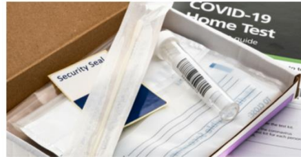
NOTE: Image of tests is only representative.

Fill in this form with your contact and shipping information to order your tests.