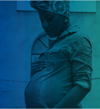
ඔබ ගර්භණීව සිටින අතරතුර