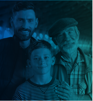
ඔබට වැඩුණු ළමයින් සිටින විට