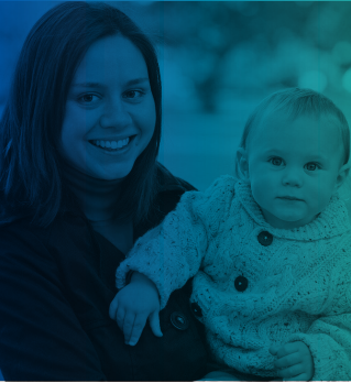
ඔබ දරු උපතක් සිදු කළ පසුව