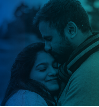
உமக்கு பிள்ளைகள் இருக்க முன்னர்