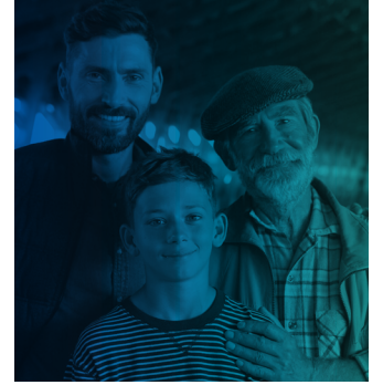
உமது பிள்ளைகள் வளரும் போது