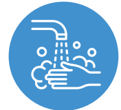
ኣእዳውካ በብእዋኑ ተሓጸብ።