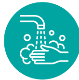
သ့နစုၣ်ခဲအံၤခဲအံၤ.