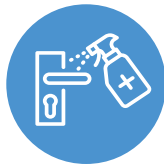
မၤသံတၢ်ဆါဃာ် တၢ်ထိးဘၣ်-အါ လီၢ်ကဝီၤ.

နမ့ၢ်ဆဲးဘၣ်ကသံဉ်ဒီသဒါပွဲၤပွဲၤလဲၣ်လဲၣ်, မၤကွၢ်နသးလၢ COVID-19 အဂီၢ်တဘျီဃီဖဲ-