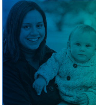
మీరు బిడ్డకు జన్మ ఇచ్చిన తర్వాత