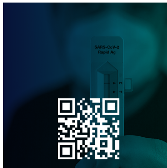
Agiza Vifaa vya Kupima